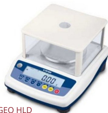
DINI ARGEO HLD

Balance fiable et idéale pour les bijouteries, les laboratoires et les industries. Peut être homologuée avec une vignette et un carnet métrologique.