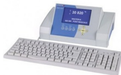
ARPEGE MASTER-K IDE 500