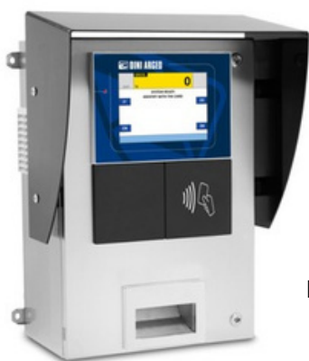
DINI ARGEO 3590DGTBOX8

Une borne de pesage autonome intègre un indicateur de poids, un lecteur de carte RF et une imprimante à ticket. Idéale pour la gestion de ponts bascules en libre-service.