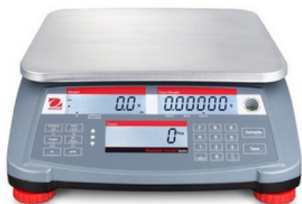
OHAUS RANGER COUNT