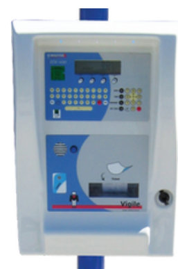
ARPEGE MASTER-K VIGILE