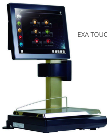
EXA TOUCHSCALE EVO

Balance idéale pour les comptoirs de vente. Homologuée pour la vente directe au public et la fiscalité LNE. Fournie avec vignette verte et carnet métrologique. Ecran tactile et afficheur couleur côté client. Efficace et intuitive, elle est simple d'utilisation.