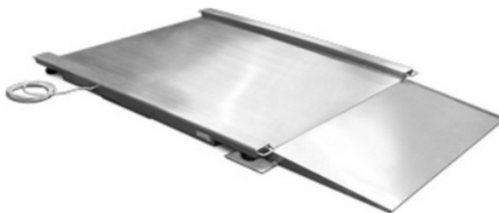
DINI ARGEO LPI