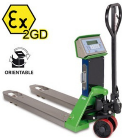
DINI ARGEO TPWX2GD