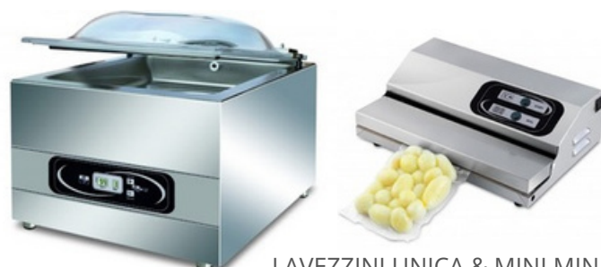
LAVEZZINI UNICA & MINI MINI

Les machines sous-vide professionnelles LAVEZZINI sont d'excellente qualité et performantes. Elles sont fabriquées entièrement en acier inox.