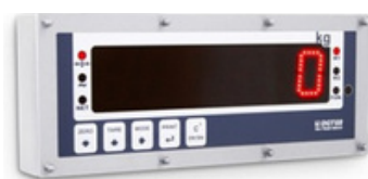
DINI ARGEO DGT60

Nous proposons une large gamme d'indicateurs de poids répondant aux besoins des intégrateurs systèmes et de l'industrie. Ils offrent des fonctionnalités dédiées au pesage de trémies, cuves ou silos et à la gestion de balances ou de ponts bascules. Ils sont certifiés pour les applications à usage commercial réglementé.