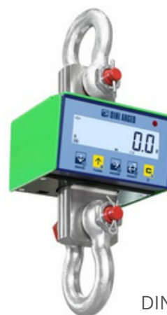
DINI ARGEO MCWN

Crochet peseur  lectronique professionnel disposant d'un grand indicateur pour la lecture du poids. Fiable et faible encombrement. Equip  d'une mallette de transport, d'une t l commande et des manilles. Compatible en homologation m trologie l gale. Port e de 300 kg   9 t.