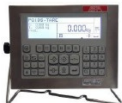
EXA CYBER PLUS