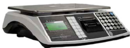
EXA MARTE EVO

Balance poids-prix pour les commerces ambulants.