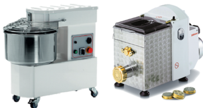
SWEDLINGHAUS IMP18S & PF2,5

Pétrin pour la préparation de pâte à pain et pizza. Cuve, spirale et barre en acier inox. Machine à pâte idéale pour pétrir et extruder la pâte en différents formats. Recommandées pour tous restaurants et producteur de pâte fraîche.