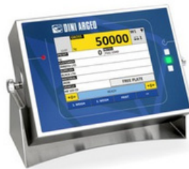
DINI ARGEO 3590EGT