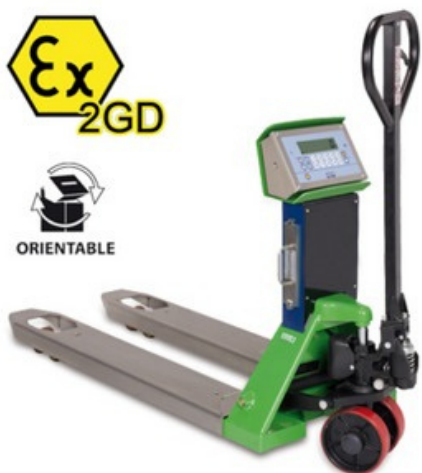
DINI ARGEO TPWX2GD