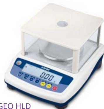
DINI ARGEO HLD

Balance fiable et idéale pour les bijouteries, les laboratoires et les industries. Peut être homologuée avec une vignette et un carnet métrologique.