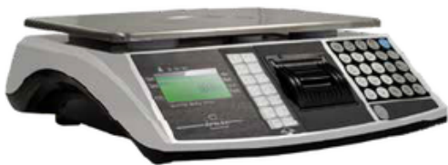
EXA MARTE EVO

Balance poids-prix pour les commerces ambulants. Homologuée pour la vente directe au public, fournie avec vignette verte 2 ans et carnet métrologique. Capacité max 15 kg. Plateau en acier inoxydable, longue autonomie de la batterie. Avec ou sans colonne